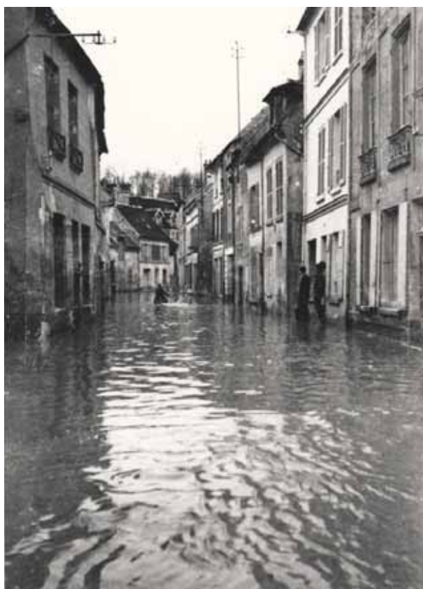
Crécy-la-Chapelle – inondations de 1941

La catastrophe est imminente lorsque la précédente n'est plus dans les esprits