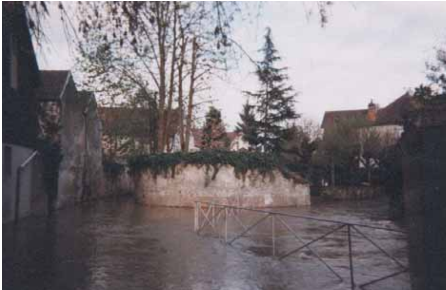
Crécy-la-Chapelle – inondations avril 1999

La catastrophe est imminente lorsque la précédente n'est plus dans les esprits